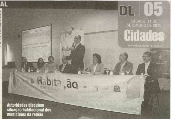
Autoridades discutem situação habitacional dos municípios da região

Os focos de atuação que fazem parte de todo o planejamento são a regularização fundiária, que contém 410 municípios conveniados, a urbanização de favelas, melhoria da qualidade do produto e sustentabilidade e incremento das parcerias.